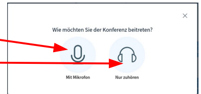
Abbildung 4: Auswahl zur Aktivierung des Mikrofons

Zunächst wirst du gefragt, ob du dein Mikrofon aktivieren oder nur zuhören möchtest.