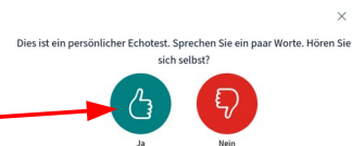
Abbildung 6: Verbindungstest

Wenn du dich selbst hören kannst, klickst du auf ja .